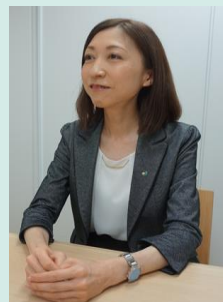
健康経営アドバイザー／管理栄養士